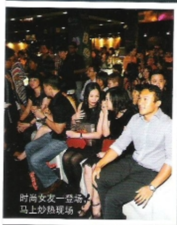
时尚女友一登场， 马上炒热现场。