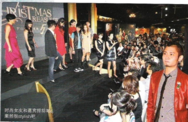
时尚女友和嘉宾排排站， 果然很stylish吧